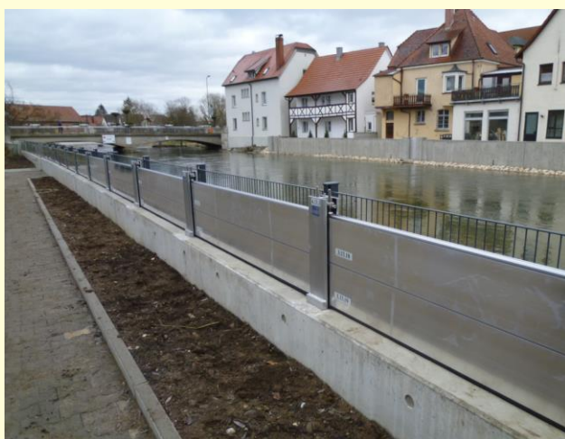
Neue Hochwasserschutzmauern / Mobile Wand